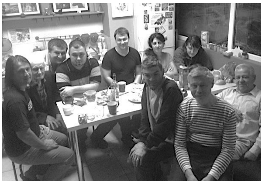
Наша дружная «Философствующая “Африка”»

Грустно было осознавать, что РФК подходил к концу, а наша встреча была столь короткой, но осмысленной. Тем не менее, были заложены прочные основы дальнейшего сотрудничества в научной