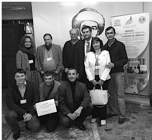
Участники круглого стола «Крым в судьбах русских философов»

Секция «Философия образования» проходила в спокойном русле и даже была отмечена несколькими выпадами докладчиков в сторону современного состояния в сфере системы образования. Доклад ташкентца, связанный с обозначением основных реформ в системе образования Узбекистана, как показалось, был интересным, а предложение «Философы и философоведы всех стран, объединяйтесь!» было воспринято на «ура».